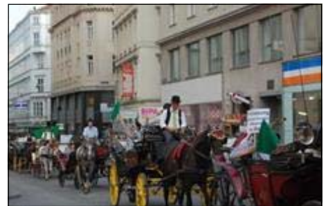
تظاهرات در نیویورک

کاروانهای صلح و آزادی که از شهرهای آمریکا و کانادا به نیویورک رفته بودند، در روزهای ۲۳ و ۲۴ سپتامبر در کنار دیگر نیروهای دموکراسی خواه در پشتیبانی از مردم ایران و در اعتراض به حضور محمود احمدی نژاد در سازمان ملل متحد، دست به تظاهرات زدند. در روز ۲۳ سپتامبر، خانم شهرنوش پارسی پور، از امضاء کنندگان بیانیه کاروان ها، در پلاتفرم کمیته همبستگی برای پیشبرد دموکراسی در ایران سخنانی را در دفاع از جنبش مردم ایران برای دستیابی به دموکراسی بیان کرد.