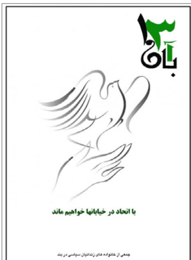
با اتحاد در خیابانها خواهیم ماند